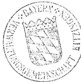
Metka Verw. Angestellte

Kitzingen, 29. 12. 92 Verwaltungsgemeinschaft Kitzingen I.R.