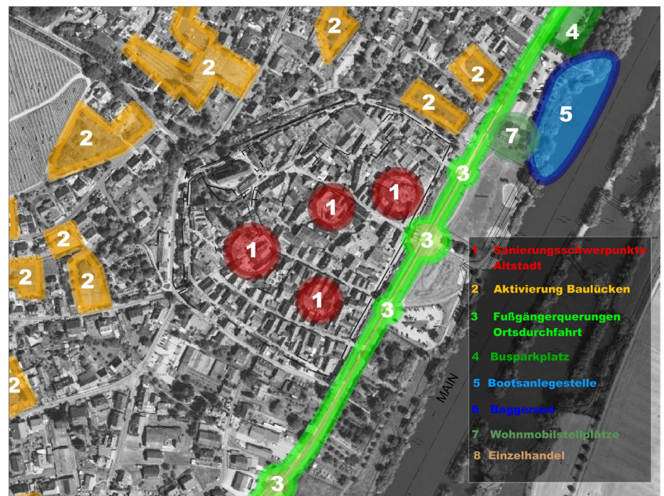
Plan mit Darstellung der ersten identifizierten Handlungsfelder (Vorentwurf)

Nutzungskonflikte und Mängel treten in erster Linie als vereinzelte Leerstände in Verbindung mit Sanierungsbedarf auf, wobei sich in einigen Quartieren des Altorts eine gewisse Konzentration findet. Probleme sind die Querung der Staats-