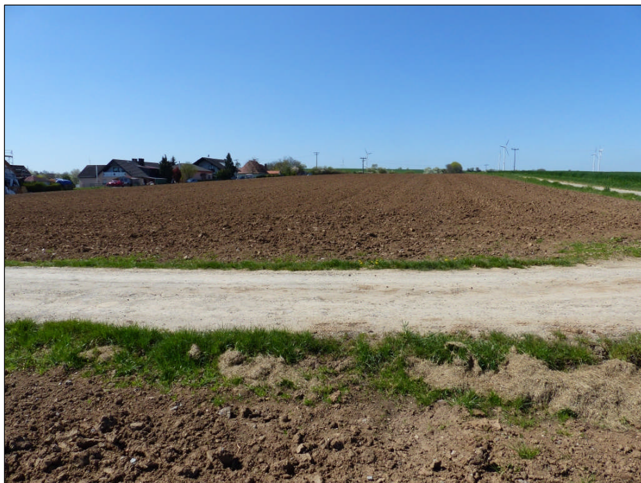
Abb. 4: Westliche Ackerfläche, Blick nach Westen (20.04.2016)