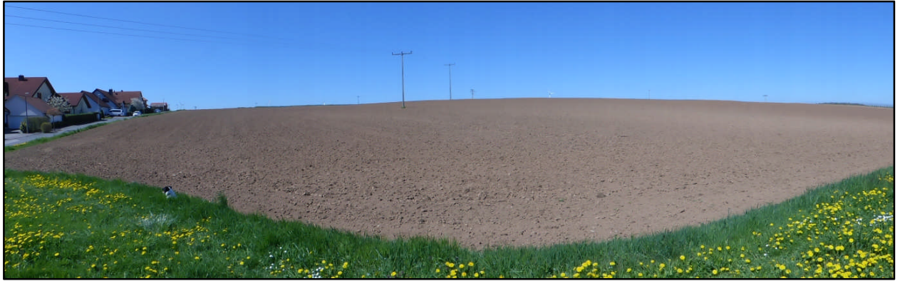
Abb. 3: Blick nach Nordwesten über den Geltungsbereich, Blick nach Westen (20.04.2016)