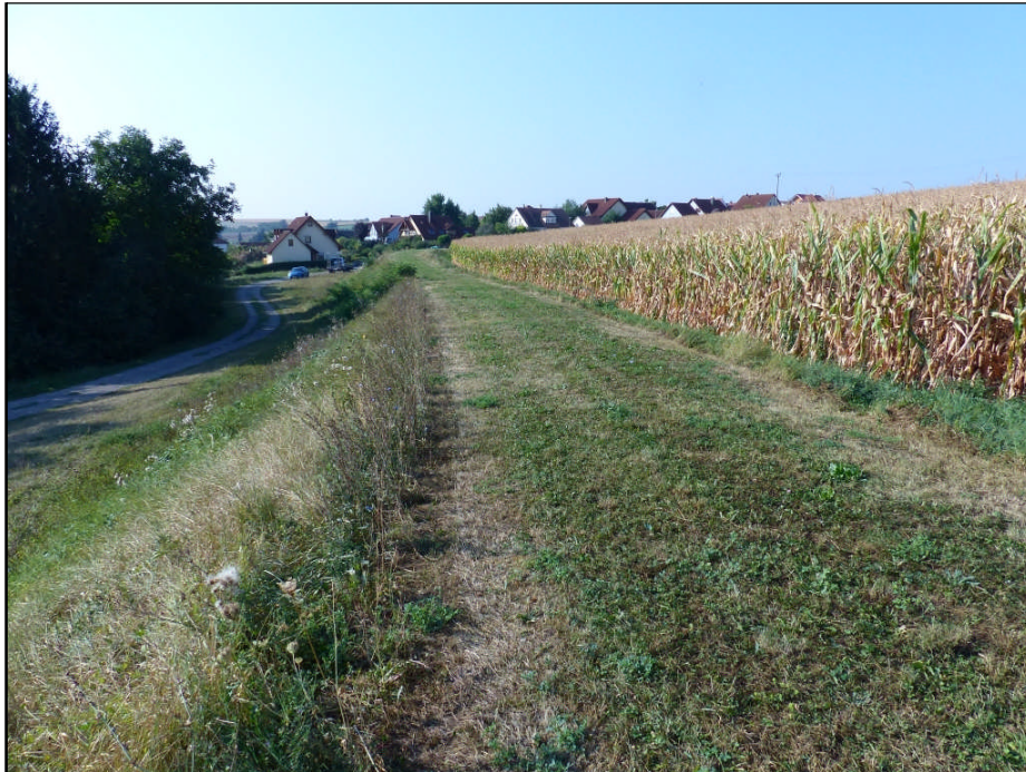
Abb. 5: Damm, Grünlandstereifen und Feldweg an der Ostgrenze des Geltungsbereiches Gärten und Hecke an der Ostgrenze des Geltungsbereichs, Blick nach Süden (14.09.2016)