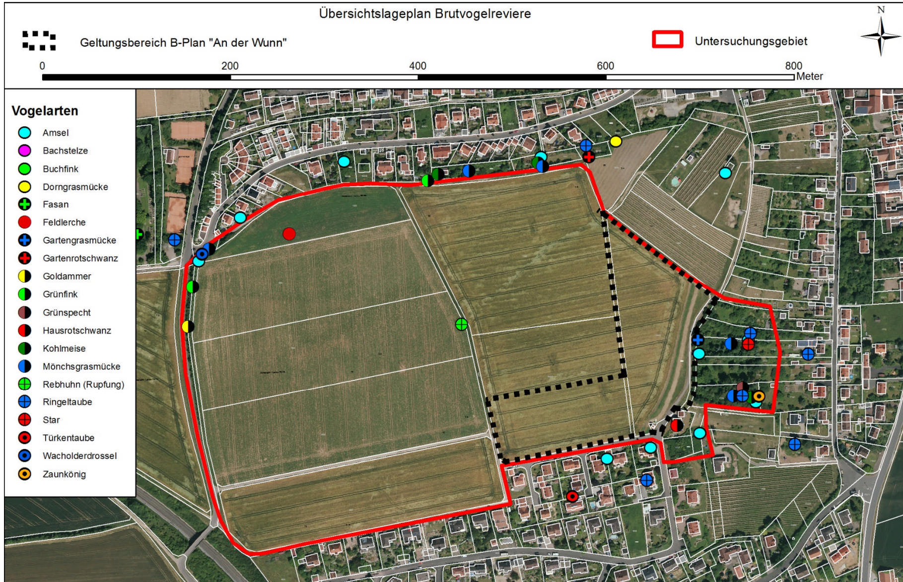
Abb. 7: Verteilung der Brutvogelarten im Geltungsbereich 2016